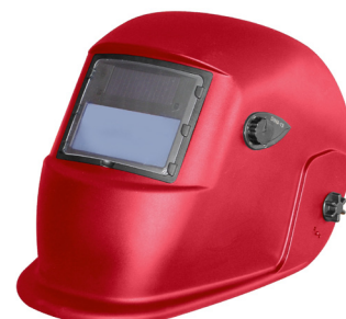
S777aRED ČERVENÁ / RED