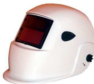
S777aWH BÍLÁ / WHITE