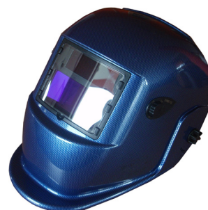
S777ac MODRÁ / BLUE