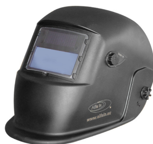
S777a ŠEDÁ / GRAY

Ochrana celé tváře, nastavitelná poloha těžiště ve dvou osách