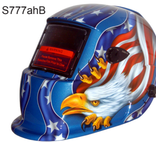
AMERIKA / AMERICA